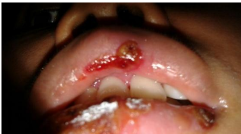
Gambar 5. Bibir bawah tampak krusta kering, tepi kemerahan, dan mudah berdarah.

Selain itu, pada langit-langit terdapat ulser, multipel, diameter 1-2 mm, berwarna kuning, dikelilingi tepi kemerahan, dan sedikit sakit. Pada lateral lidah terdapat ulser, multipel, diameter 1-2 mm, berwarna kuning, dikelilingi tepi kemerahan, dan sedikit sakit. Terapi yang diberikan sama dengan kunjungan pertama.