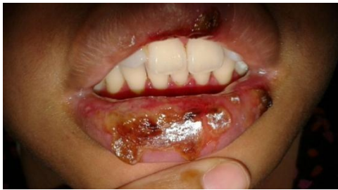
Gambar 4. Bibir atas tampak krusta, kering, tepi kemerahan, dan mudah berdarah.

sedikit sakit. Obat diminum dengan teratur dan nafsu makan membaik. Pemeriksaan ekstra oral menunjukkan bibir atas dan bawah terdapat krusta kering berwarna kuning, tepi kemerahan, masih tampak ada darah, dan sakit bila digerakkan (Gambar 4 dan Gambar 5).