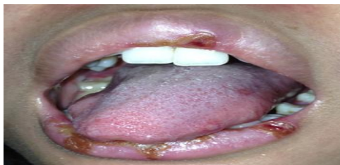
Gambar 3. Ulser pada lateral lidah

Pasien juga mengeluh adanya sariawan pada lidah dan langit-langit rongga mulut yang membuat pasien kesulitan menelan (Gambar 3).