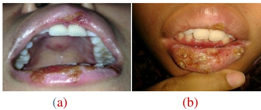
Gambar 1. (a) Ulser pada bagian atas, (b) Ulser pada bagian bawah

Seorang pasien wanita usia 32 tahun datang ke klinik dengan keluhan luka terasa panas terbakar pada bibir atas dan bawah, terasa sakit dan mengganggu penampilan. Berdasarkan anamnesis pasien mengatakan bahwa awalnya sekitar 5 hari yang lalu, pasien merasa demam, lemas/ malaise, dan pusing, serta muncul gelembung-gelembung kecil pada bibir bawah, tidak sakit, tidak gatal, dan tidak terasa panas. Pasien melakukan penanganan dengan memberi obat tetes albotyl pada permukaan gelembung. Malam harinya gelembung tersebut pecah dan mengeluarkan cairan. Keesokan harinya, luka semakin lebar hampir setengah bibir bawah dan pada bibir bagian atas. Bagian bibir mulai terasa panas, sakit, dan sangat mengganggu penampilan. [2] Ulser pada bibir atas dan bawah ditunjukkan pada Gambar 1.