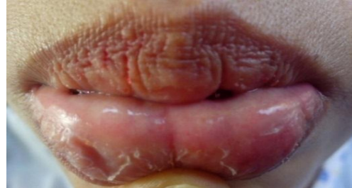
Gambar 6. Bibir kering, ulser pada bibir sudah sembuh

bawah sudah sembuh hanya bibir atas dan bawah tampak kering (Gambar 6).