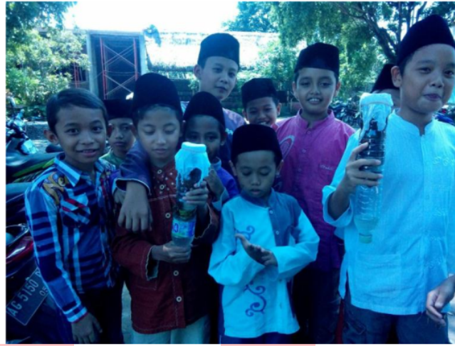
Gambar 3. Peserta Penyuluhan Menunjukkan Hasil Penjernihan Air