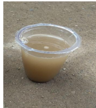
Gambar 4. Hasil Praktek Mandiri Peserta Pengabdian Masyarakat (a) Setelah Penjernihan dan (b) Sebelum Penjernihan