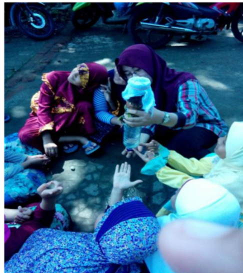
Gambar 2. Proses Penjernihan Air Secara Sederhana

2 Berdasarkan hasil pengamatan selama proses pengabdian masyarakat diketahui siswa SD Islamic International School Pesantren Sabilil Muttaqien mampu melakukan penjernihan air secara sederhana dengan menggunakan pasir, sabut air, pecahan genteng, pasir, dan arang. Evaluasi hasil yang dilakukan pada kegiatan pengabdian ini melalui kuesioner yang dikerjakan oleh mitra, kuisisioner tersebut berisi tentang pertanyaan yang terkait materi tentang cara penjernihan air secara sederhana. Indikator keberhasilan kegiatan pengabdian ini adalah apabila 80% tingkat pengetahuan setelah kegiatan lebih tinggi daripada tingkat pengetahuan sebelum kegiatan.