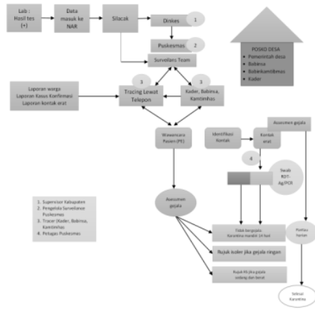
Gambar 3. Skema Pelacakan dan Testing UPTD Puskesmas Pare, Kabupaten Kediri

Supervisor surveilans dari Dinkes Kabupaten Kediri melakukan pengecekan di website silacak, kemudian memberi informasi dan data kepada petugas surveilans UPTD Puskesmas Pare, Kabupaten Kediri. Selain itu, tim surveilans yang terdiri dari kader, bidan, BABINSA, dan BHABINKAMTIBMAS juga mendapatkan informasi kasus konfirmasi dari laporan warga, laporan kontak erat, dan laporan kasus konfirmasi. Tim kemudian melakukan pelacakan melalui telepon untuk mengidentifikasi gejala yang dialami dan memutuskan tindakan lanjut yaitu jika tidak bergejala melakukan karantina mandiri selama 14 hari, jika gejala ringan akan dirujuk ke area isolasi, dan jika memiliki gejala sedang atau berat maka akan dirujuk ke Rumah. Tim kemudian melakukan identifikasi kontak dan pelacakan kontak erat beserta identifikasi gejala. Setelah itu petugas surveilans melakukan pemeriksaan swab RDT-Ag pada kontak erat, baik hasil pemeriksaan positif atau negatif dilakukan tindak lanjut yaitu kontak erat yang tidak bergejala melakukan karantina mandiri selama 14 hari.