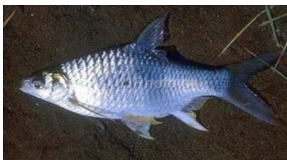
Gambar 1. Barbonymus gonionotus (Ikan Bader) hidup diperairan Sungai Brantas

Peta lokasi pengambilan sampel disajikan pada Gambar 2. Penentuan titik pengambilan sampel menggunakan metode purposive sampling , dimana lokasi ditentukan berdasarkan tujuan yang diinginkan dan keberadaan sampel. Pengambilan sampel yaitu air sungai, Barbonymus gonionotus dan Ipomea aquatica dilakukan dengan metode purposive sampling tanpa melakukan replikasi, setiap sampel ditandai dengan label name dan dibawa ke Laboratorium BARISTAND Surabaya.