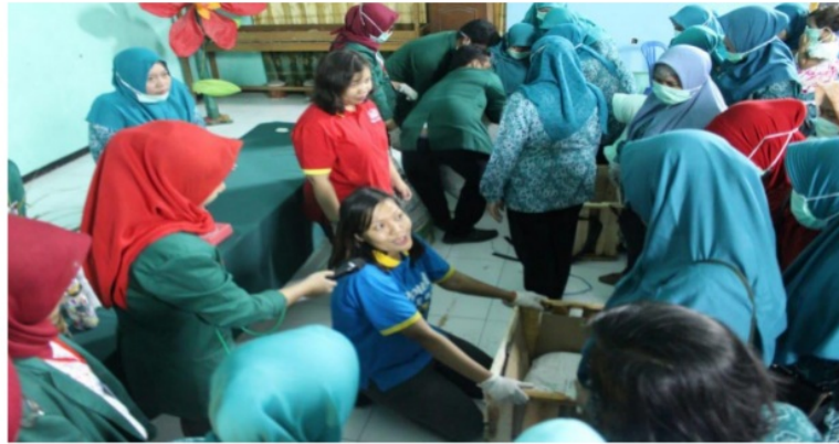
Gambar 3. Simulasi Pembuatan Kompos Dari Sampah Organik Rumah Tangga