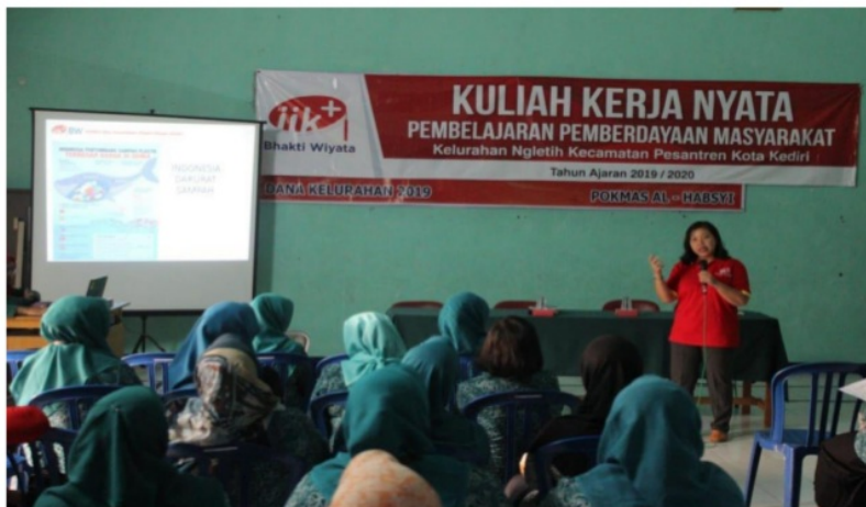
Gambar 2. Penyampaian Materi Penyuluhan Tentang Sampah Pada Ibu-Ibu PKK

perbedaan rerata yang bermakna antara skor pengetahuan sebelum dan setelah dilakukan penyuluhan tentang sampah. Sehingga dapat dikatakan bahwa penyuluhan yang telah dilakukan berhasil meningkatkan pengetahuan responden tentang sampah.