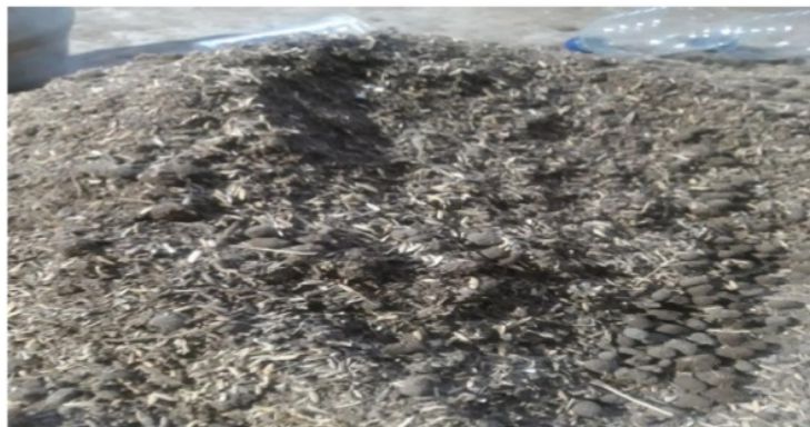
Gambar 5. Hasil Kompos Dari Sampah Organik Rumah Tangga

Kompos dibuat dari sampah organik rumah tangga yang mudah membusuk berupa sisa makanan, sayuran, buah-buahan, daun dan bahan lain yang mudah membusuk. Alat pengomposan yang digunakan merupakan alat sederhana yang