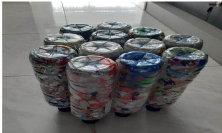
Gambar 4. Hasil Pembuatan Ecobrick